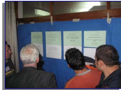
Шема на работни групи и распределба во работни групи