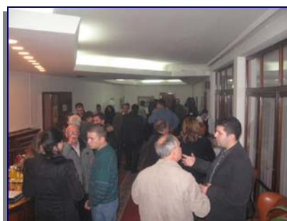
Кафе пауза и меѓусебно запознавање