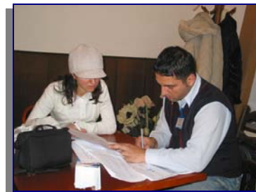
Припрема на благодарници