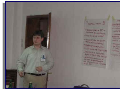
Презентирање на заклучоците од работните групи