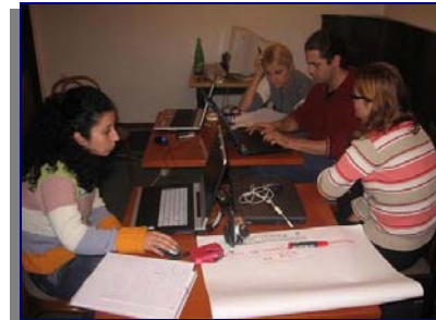
Подготовка на извештаи