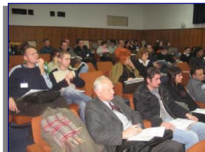
Учесници на 5-та Годишна средба на еколошките НВОи во Р. Македонија