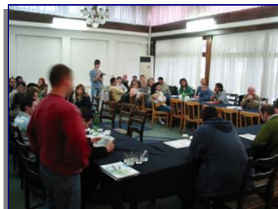
Пленарна сесија – презентирање на заклучоци