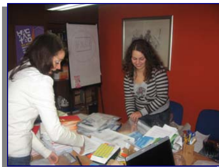
Дел од атмосферата пред почеток на средбата