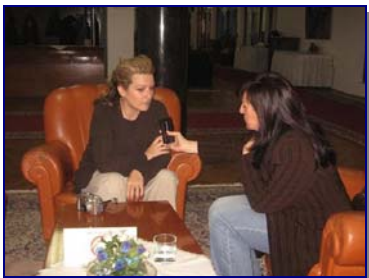
Интервју за Радио Скопје