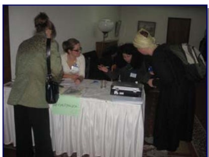
Регистрација на учесниците