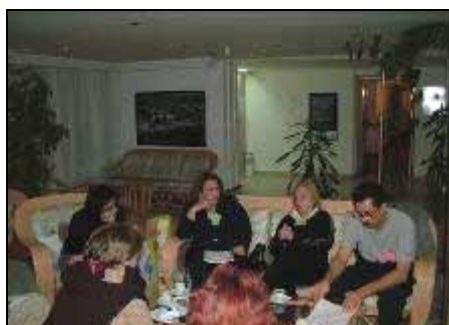
„Како да се примени Архус?“ - работа во мали групи

ДОНАТОРИ: НЕ ФИНАНСИРАЈТЕ ПРОЕКТИ, ТУКУ ПОДРЖЕТЕ ЈА ФИНАНСИСКАТА НЕЗАВИСНОСТ НА ДРУШТВАТА - ТОА ТРЕБА ДА БИДЕ ГЛАВНИОТ ПРОЕКТ ВО КОЈ КЕ ИНВЕСТИРАТЕ