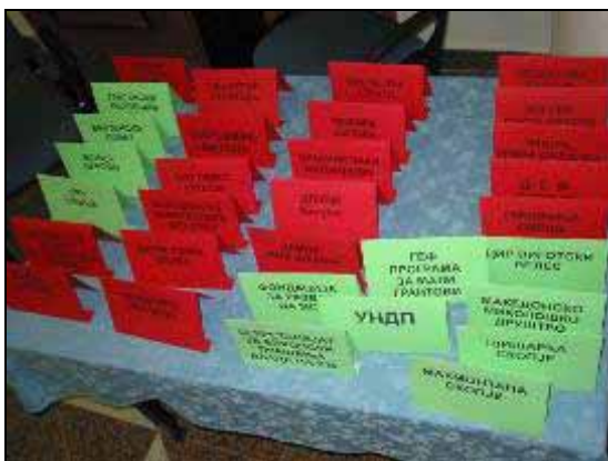
Листи на учесници