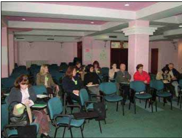
Учесници на работилницата „Вклучување на јавноста во процесот на изработка на законска и друга регулатива за животна средина“