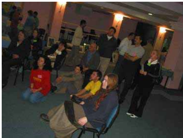
Внимателно на саемските презентации