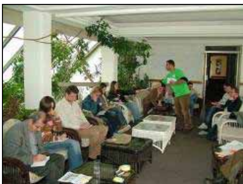
Атмосфера од работилницата: „Вмрежување и партнерство“