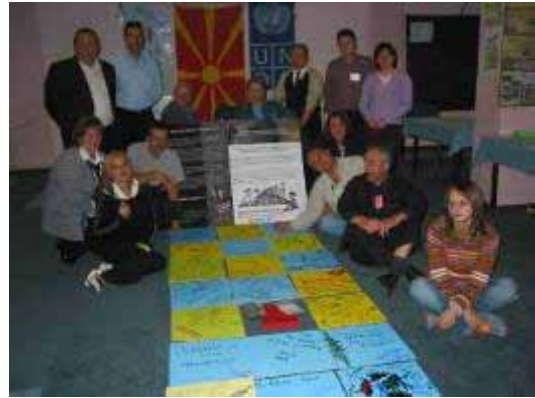
Пораки до Светот... ОЗОН... мир... Здрава животна средина... љубов...