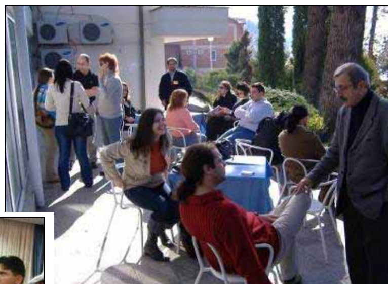
Пауза... кафе со малку муабет