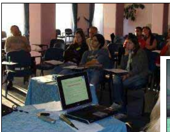
Присутни учесници на работилницата за „Енергетска ефикасност“