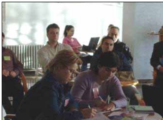
Работа и запознавање со Трите Рио Конвенции