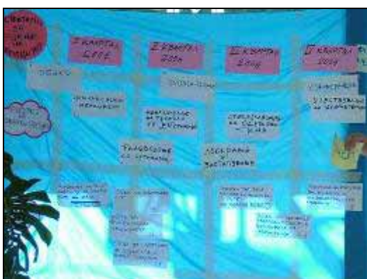
Работилница: „Зајакнување на капацитетите на Здруженијата на граѓани“