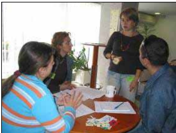
Дел од работата во „Лобирање и застапување“