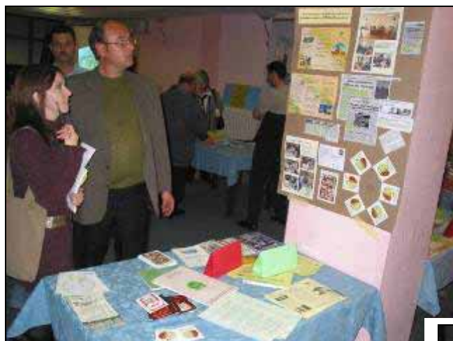
Неформални разговори за поуспешна соработка и размена на мислења