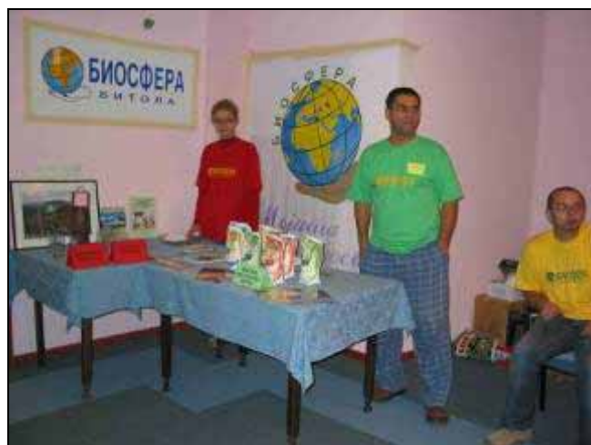
Представување во соработка со локалната самоуправа и бизнис секторот