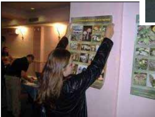
Работа... прашања... одговори...

Здруженијата на граѓани имаат можност да делуваат!