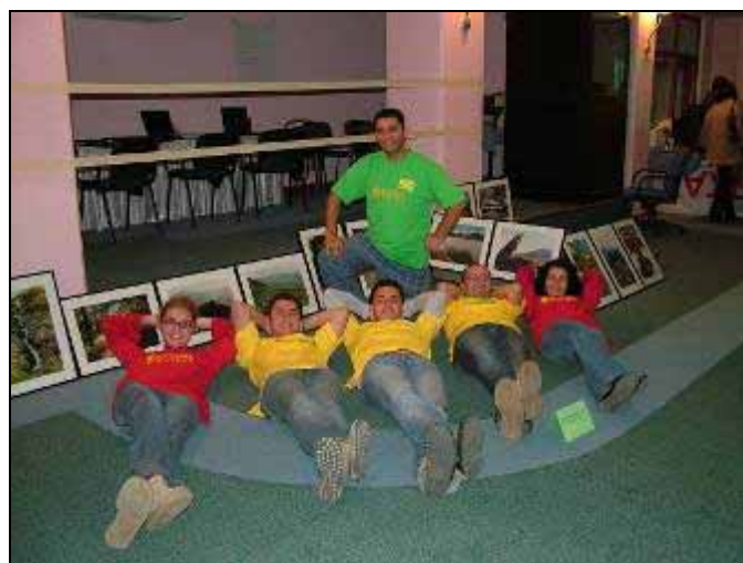
Членовите на Биосфера